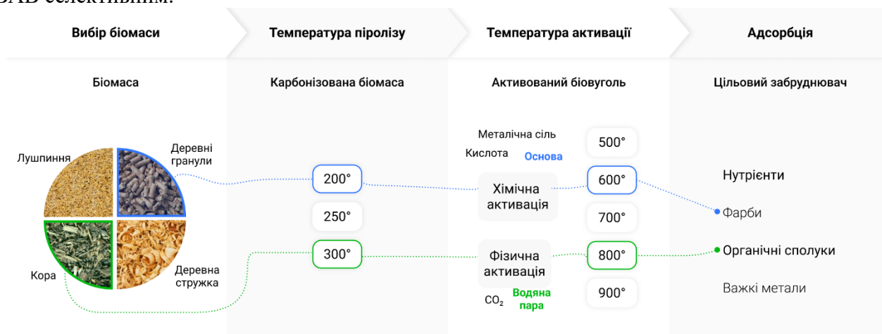
Рис.1. Ілюстрація гіпотези, синя та зелена лінії представляють можливі шляхи вибору параметрів виробництва та результати цього вибору

За основу цього дослідження взято припущення що властивості БАВ можна змінювати та проектувати за допомогою контролю параметрів виробничого процесу для створення БАВ для конкретних цільових застосувань. Ілюстрацію цієї гіпотези можна знайти на рис. 1. Іншими словами, створення певної структури пор і хімічного складу поверхні БАВ є процесом вибору правильної процедури виробництва. Правильна процедура виробництва дозволяє створити БАВ з покращеними властивостями для адсорбції певного цільового забруднювача, що робить БАВ селективним.